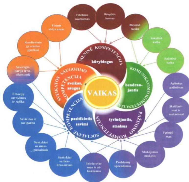
1 pav. Vaikų ugdymo(si) pasiekimų sričių jungimas per kompetencijas pagal tai, kokį vaiką siekiame išugdyti

Mokyklos-darželio ikimokyklinio ugdymo programoje numatytas ugdymo turinys leidžia pedagogui kūrybingai organizuoti savo veiklą, ją įvertinti ir koreguoti, atsižvelgiant į kiekvieno vaiko amžių, jo patirtį, vaiko bei grupės individualumą. Pedagogai gali laisvai rinktis ugdymo(si) būdus bei metodus, lanksčiai, kūrybiškai taikyti siūlomą ugdymo turinį (planuoti veiklą, parinkti ugdomąją medžiagą). Ugdymo turinys orientuotas į vaiko vertybinių nuostatų, gebėjimų, žinių ir patirties ugdymą. Ugdymo turinyje svarbu sudaryti galimybes pačiam vaikui susikurti, keisti, pertvarkyti aplinką, kurti vaikų ugdymosi situacijas, kupinas žaismės, nuotykių, atradimų, kurti situacijas, kurios skatintų vaikus spręsti problemas, tyrinėti ir kritiškai mąstyti. Skatinti vaikų veiklą grupelėmis, sudaryti galimybes vaikams patiems ieškoti informacijos, žaisti su šiuolaikinio vaiko poreikius atitinkančiais žaislais, sudaryti galimybes naudotis informacinėmis technologijomis ir sąlygas ugdyti (s) gabiems vaikams.